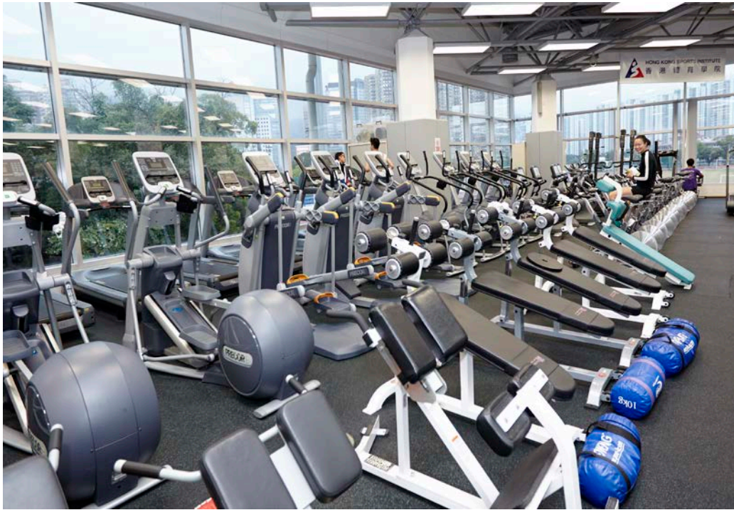
(香港體育學院體能訓練中心)